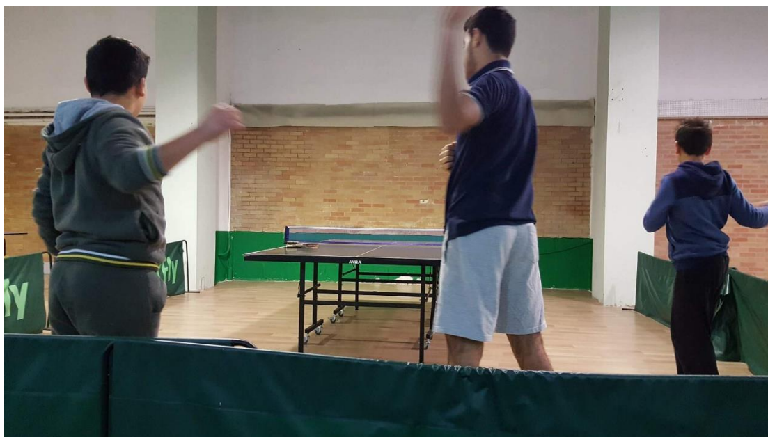
Αθλητισμός – Επιτραπέζια αντισφαίριση