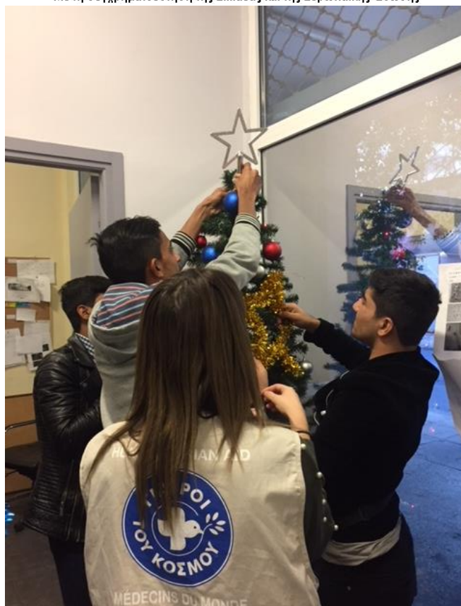
Ετοιμάζοντας τα δικά τους στολίδια για το δέντρο

«Ισότητα, Αλληλεγγύη, Προστασία» Με τη συγχρηματοδότηση της Ελλάδας και της Ευρωπαϊκής Ένωσης