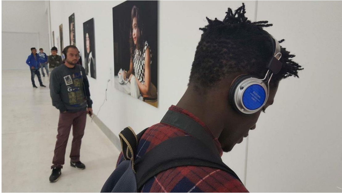
Μουσείο Σύγχρονης Τέχνης – Ατενίζοντας και ακούγοντας το μέλλον

«Ισότητα, Αλληλεγγύη, Προστασία» Με τη συγχρηματοδότηση της Ελλάδας και της Ευρωπαϊκής Ένωσης